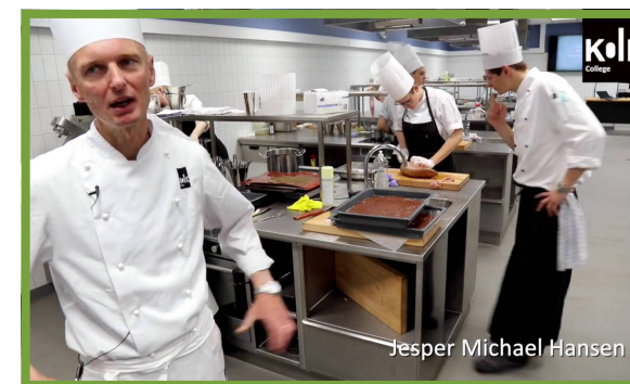
Kold College - et køkken skabt til at lære - YouTube

Typisk er det angst for eksamen og at det er stort for dem at bestå svendeprøven efter 4 år. Det er første gang de lykkedes med noget i livet, og det er ikke nogen lille eksamen. Der ligger lidt pres på fra arbejdsgiveren, når det forventes at eleven karaktermæssigt lever op til den seneste elev på arbejdspladsen, der fik en god karakter. Vi skal ikke glemme hierarkiet i kokkeverden, selvom det kun er eksamen.