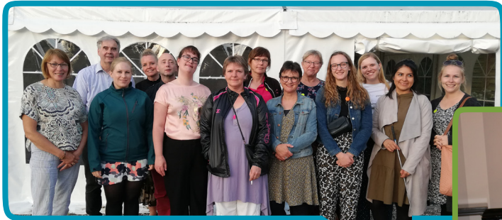
Sommerfest i Samtaleboblen