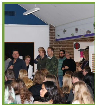
Billede: workshopteamet præsenteres for 180 elever i fællessalen.