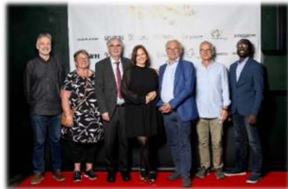
Frivillige Galla sept. 2025