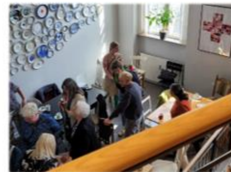
Ensomhedscharter, Røde kors